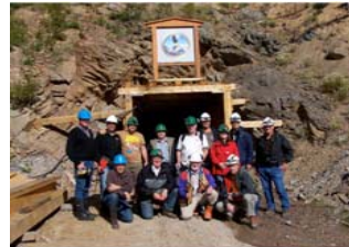
Eagle Peak Au & Cu 金&铜