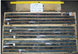
TTM Mo. 钼