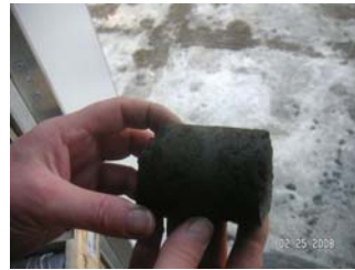
Iron Stone Lignite 褐煤