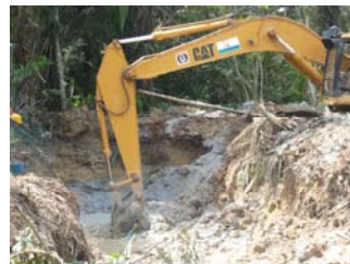
Global Gold Alluvial Gold 砂金