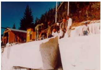
Leo D'or Marble大理石