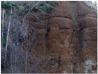
Iron Stone Fe/V 铁/钒